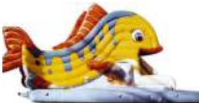
POISSON TROPICAL GONFLABLE