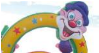
JOYEUX CIRQUE GONFLABLE