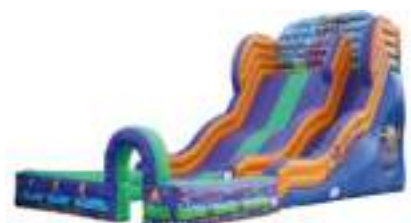
TOBOGGAN GEANT GRAND HUIT