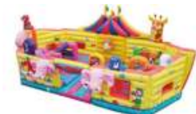
LE ZOO DU CIRQUE GONFLABLE