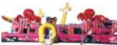
GRAND GALION GONFLABLE