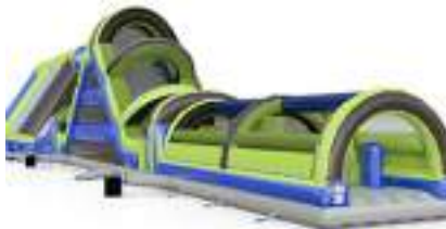
PARCOURS CHALLENGER TOBOGGAN GONFLABLE