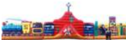
GRAND CANYON GONFLABLE