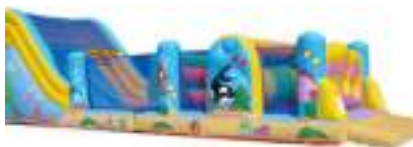
OCEAN PACIFIQUE GONFLABLE