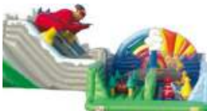
EXTREME GLISSE GONFLABLE