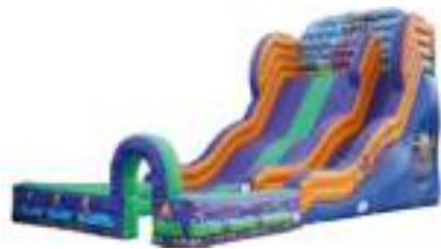
TOBOGGAN GEANT GRAND HUIT