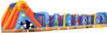
OCEAN GEANT GONFLABLE