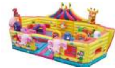
LE ZOO DU CIRQUE GONFLABLE